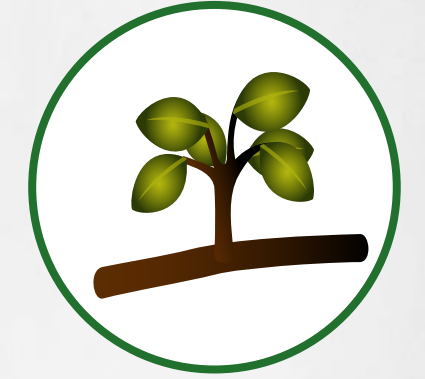
Maturation des fruits