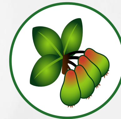
Développement des fruits